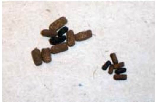
Figur 2. Spillning av läderbagge (vänster) och en guldbagge-art (höger). Läderbaggespillning är större och plattad, till skillnad från guldbaggar som har mindre, mer cylindrisk spillning. Yngre larver av läderbagge lämnar mindre spillning som är svårskild från spillning av Gnorimus -arter, varför man bör leta efter fullväxta larvers spillning som är 6-7 mm lång.