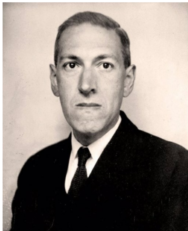
Foto av H.P. Lovecraft från 1934.