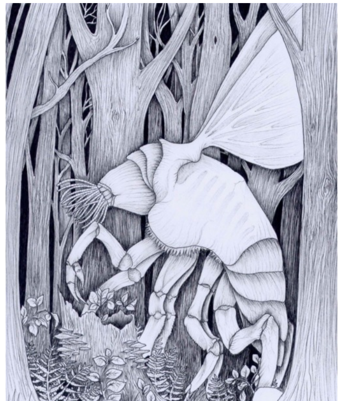
Konstnärlig gestaltning av en Mi-Go byggd på hur den beskrivs i H.P. Lovecrafts novell The Whisperer in Darkness .

Många av Lovecrafts texter har legat till grund för filmatiseringar. En mycket lyckad sådan är den tyska Die Farbe från 2010, baserad på novellen The Colour of Space från 1927. Enda insekten i filmen är dock en förväxt geting som sätter sig på en bondkvinnas huvud i en mycket vacker scen. Mycket lyckad är även den likaså svartvita