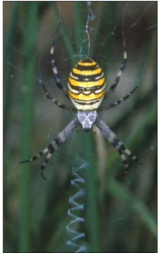
Fig. 2. Hona av getingspindel ( Argiope bruennichi ) med artens karakteristiska sick-säckformiga stabiliment. Denna getingspindel är fotograferad i Spanien i september 1986.

Adult female of ( Argiope bruennichi ) from southernmost Sweden, Skåne, southwest of Staffanstorp.