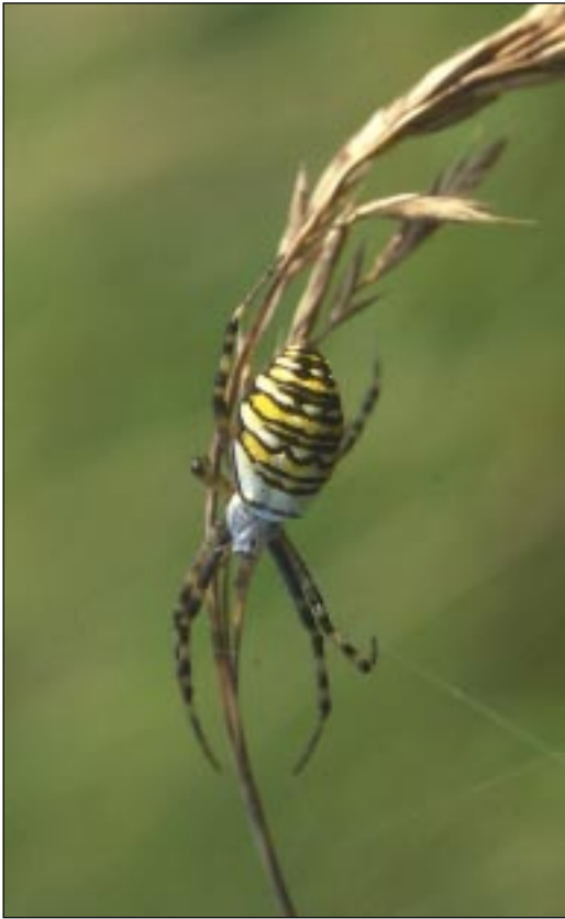
Fig. 1. Hona av getingspindel ( Argiope bruennichi ) på vägbank sydväst om Staffanstorp i Skåne.

Adult female of ( Argiope bruennichi ) from southernmost Sweden, Skåne, southwest of Staffanstorp.