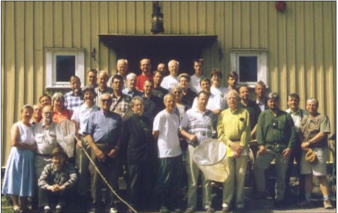
Deltagare under elfte svenska entomologmötet i Uppland, juni 2000.

Det konstaterades att samlingarna har ett mycket stort värde som dokumentation av fynduppgifter för olika arter, för vetenskapliga studier av släktskap och utbredningsmönster och dessutom som biologiska arkiv för naturvården. Se vidare i en artikel av Göran Andersson i detta nummer av Entomologisk Tidskrift.