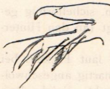
Fig. 2. Thyas dentata S. THOR. Larve, Palpenspitze. X 495. Man sieht die beiden nach unten gerichteten Kammborsten.