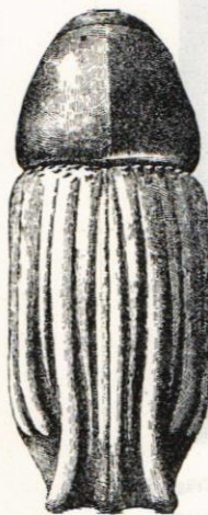
Fig. 3. Carphoborus rossicus SEM. Originalzeichnung.

Diese bis jetzt noch sehr seltene Art unterscheidet sich durch ihre bis zur Basis der Flügeldecken abwechselnd rippenförmig erhöhten Zwischenräume (1-er, 3-er, 5-er, 7-er, 9-er) von allen übrigen europäischen Borkenkäfern (fig. 3). Sie