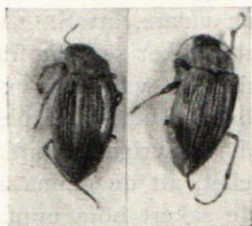
Fig. 3. Till vänster Brychius elevatus cristatus J. SAHLB. från Uleåborg i Finland (leg. SAHLBERG), till höger B. elevatus typicus PANZ. från Ilidze i Bosnien (leg. SAHLBERG). Båda exemplaren äro av SAHLBERG betecknade som typiska. Olikheterna i kristans utseende framträda också tydligt å figuren.

som ock naturligen i någon mån är underkastad variation. En annan olikhet mellan de båda arterna består däri, att de nämnda längslisterna på elytra ha olika punktur och ofta även färg. Hos elevatus PANZ. äro desamma fint, men även för vanlig luppförstoring tydligt punkterade, och punkterna äro oftast, åtminstone i kristans mittdel, svarta. Även hos cristatus J. SAHLB. visar sig kristan under mikroskopförstoring punkterad, men punkterna äro så små, glesa och grunda, att de vid svagare förstoring äro så lite iakttagbara, att listen också sägs vara opunkterad. Då punkterna hos denna art aldrig äro svarta, är kristan alltid ljus.