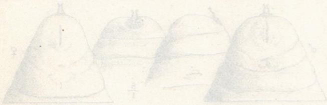
Fig. 27. Ögonen växel I. Toppen delade.

Somit liefert auch die Morphologie der Larven eine volle Berechtigung zum Aufstellen von H. incognitus als eine von H. pulustris wohl abge sonderte Art.