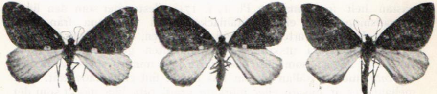
Fig. 7—9. Dystroma latefasciata STGR. ab. nigerrimata HEYD. nom. coll.

ab. perfuscata HEYD. förekommer i större utsträckning än den förra (Pl. 1, f. 20 och 21 bilda övergång till denna form), mittfältet är här överpudrat med gråbrunt i större eller mindre grad, även äro bakvingarna oftast mörkare. Denna form övergår i