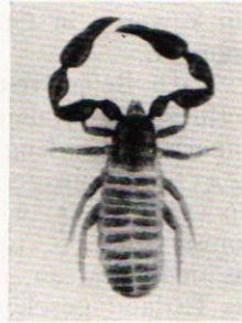
Abb. 5. Lamprochernes nodosus (Schränk). Abb. 6. Lamprochernes godfreyi (Kew). Abb. 7. Lamprochernes chyzeri (Töm.).

Dalsland: Håbol, am See Torrsjön, 26.V.1938, 1 ♀ 1 juv. — Edsleskog in der Nähe der Kirche, 11.VI.1938, 5 ♀ (alle mit Eiern: 21, 23, 26, 29 und 31).