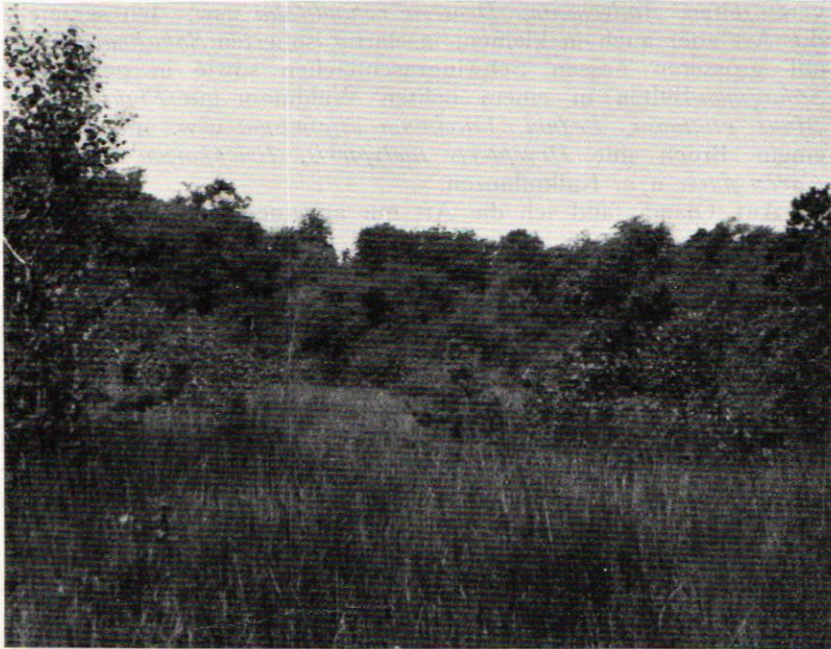
Abb. 4. Öland, Köping, von Alnus -Bruchwald umgebenes, offenes Juncus subnodulosus -Quellmoor: ein Biotop des Microbisium brevifemoratum (Ellingsen).

Im Sommer 1932, als ich bei meiner Geländearbeit zum ersten Male den Pseudoskorpionen nähere Aufmerksamkeit widmete, traf ich diese Art, neu für die schwedische Fauna, an je einem Fundort im nordöstlichen Småland (Dalhem) und nördlichen Östergötland (Krokek). Seither habe ich sie in allen Gegenden Südschwedens gefunden, wo ich eine einigermaßen umfangreiche Einsammlungsarbeit durchführte: im nordöstlichen Skåne (Hjärsås, Hästveda, Vånga und Näsrum, zusammen 6 einzelne Fundorte) und im west-