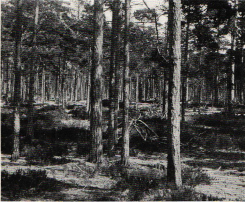
Abb. 14. Gotska Sandön, lichter Kiefernwald, Sandboden mit Cladonia , Calluna usw.: ein Biotop des Toxochernes nigrimanus (Ellingsen).

genus fehlen solche. Hinsichtlich der Dimension der Pedipalpenglieder finden sich deutliche Unterschiede vor: bei T. nigrimanus ist das Femur beim ♂♀ ca. 2,6 mal, die Tibia beim ♂♀ ca. 2,1 mal und die Schere (ohne Stiel) beim ♂ 2,8 mal bzw. beim ♀ 2,9 mal so lang wie breit (bei T. montigenus sind die entsprechenden Werte: 2,8—2,9, 2,2—2,3 und 2,7—2,8; die Pedipalpen des ♀