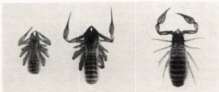
Abb. 1. Chthonius tetrachelatus (Preysl.). Abb. 2. Chthonius ischnocheles (Herm.). Abb. 3. Microbisium brevifemuratum (Ellingsen).

Diese Art ist in Europa weit verbreitet und wurde auch im östlichen Nordamerika gefunden. Die Angabe Beiers (1932 I, S. 48), dass sie »ganz Europa« bewohnt, erfordert jedoch eine gewisse Einschränkung. So konnte sie z. B. in den ostbaltischen Ländern noch nicht nachgewiesen werden und war übrigens zu dem Zeit-