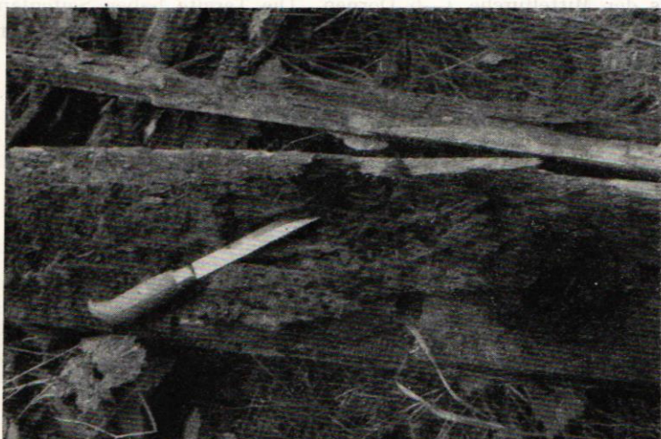
Fyndort för Aesalus scarabaeoides Panz.