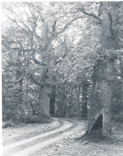
Ihåliga ekar vid Bjärka-Säby med många hotade skalbaggar.

HJÄRTLIGT VÄLKOMMEN TILL DET MÅNGFORMIGA ÖSTERGÖTLAND 1995!