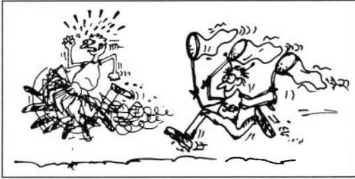
Insamling av möjlig ET-prenumerant - en svärfångad ras som av ökänd anledning blivit allt sällsyntare i Sverige? Eller kanske bara förbisedd? Teckning: Tobbe Helin.

5000 prenumeranter! En av detta nummers skribenter har lyckats med konststycket att erövra fem nya prenumeranter på en månad, och själv har jag under de senaste två åren - utan hot om våld - rekryterat 16 nya prenumeranter. Flertalet av dessa är varken utpräglade entomologer eller ens medlidsamma släktingar till mig. De är vad man skulle kunna karaktärisera som allmänt naturvårdsintresserade personer med gryende nyfikenhet på insekter. Jag tror också att det är just bland dessa personer vi hittar huvuddelen av morgondagens prenumeranter. De riktigt hängivna entomologerna i landet är en tämligen konstant och liten skara, som det inte finns några tecken på dramatisk ökning av under de närmaste åren. Förmodligen hänger detta samman med att tröskeln att ta sig över är förhållandevis hög för att lära sig identifiera insektsarter: från att börja insamla, nåla upp, etikettera och nyckla sig vidare i bestämningstabeller som i förstone nog kan te sig ganska snåriga. Men likväl finns det i Sverige en stor skara naturvårdsintresserade som är nyfikna på insekter och som ET borde kunna nå, med förmedling av den stora kunskapsmängd som finns bland dagens svenska entomologer och ekologer. Att ET fyller en allt viktigare roll också inom de statliga organisationernas bevakning av naturvårdsfrågor, vittnar nya prenumeranter i form av skogsvårdsstyrelser och länsstyrelsernas naturvårdsenheter om.