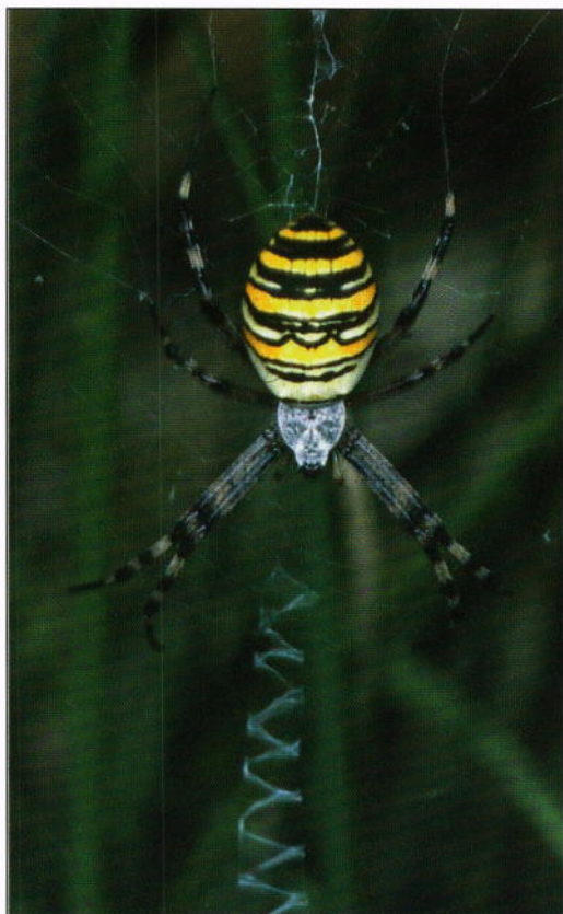
Fig. 3. Hona av getingspindel ( Argiope bruennichi ) med artens karakteristiska sick-sackformiga stabiliment. Denna getingspindel är fotograferad i Spanien i september 1986.

Getingspindeln påträffas i en mängd olika miljöer, både ganska torra och mer eller mindre fuktiga (Sacher & Bliss 1990, Merrett 1990, Martin 1991). Biotoperna domineras oftast av gräs. Vegetationen är för det mesta gles och väl genomluftig, normalt med öppna partier. Alla miljöer där getingspindeln lever har det gemensamt att de blir ordentligt uppvärmda (Höser 1992). Van-