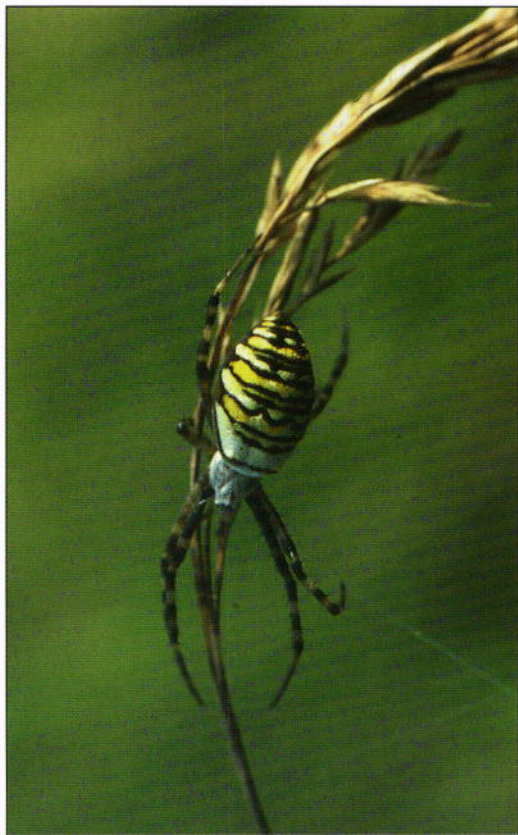
Fig. 2. Hona av getingspindel ( Argiope bruennichi ) på vägbank sydväst om Staffanstorps i Skåne.

Adult female of ( Argiope bruennichi ) from southernmost Sweden, Skåne, southwest of Staffanstorps.