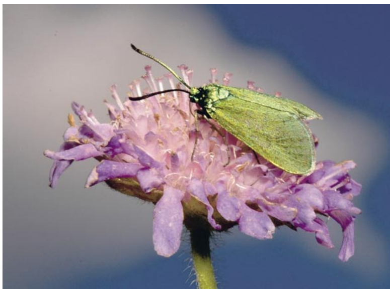
Figur 3. Allmän metallvinge-svärmare ( Adscita statice ).

sommar. På eftermiddagen kunde inventering ske till ca kl. 16 på högsommaren eller någon timme tidigare på vår och sensommar eller vid svalt/mulet väder. Enstaka dagar med mycket varmt, lugnt och soligt väder under sommaren var fjärilarna aktiva till ca kl. 18, och inventeringen fortsatte då ibland till denna tid. Vid