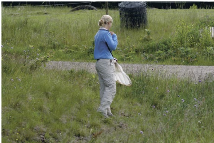
Figur 5. En blomrik vägren vid Bergön och en hästbetad hagmark i bakgrunden.

A road verge at Bergön and a pasture grazed by horses in the background.