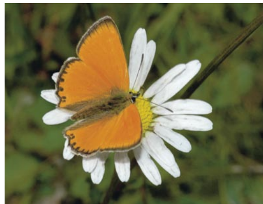
Figur 7. Vitfläckig guldvinge ( Lycaena virgaureae ).