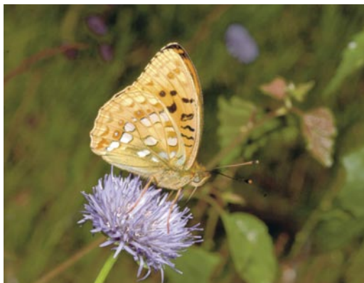
Figur 6. Skogspärlemorfjäril ( Fabriciana adippe ).

De drastiska abundansskillnaderna mellan åren för bl.a. pärlemorfjärilarna (Fig. 2) kan förvåna, eftersom deras näringsväxter violer har långlivade individer. Sannolikt är det vädret som spelar störst roll för variationen, men vi kan inte utesluta parasitoider som orsak, eftersom de kan påverka populationsutvecklingen