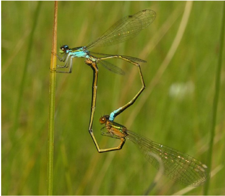
Figur 1. Hona och hane av dvärgflickslända Ne-halennia speciosa i parningshjul. Notera honans bruna färg gentemot hane's turkosa.

Female and male of Ne-halennia speciosa in copulation wheel. Note the brown color of the female and the turquoise color of the male.