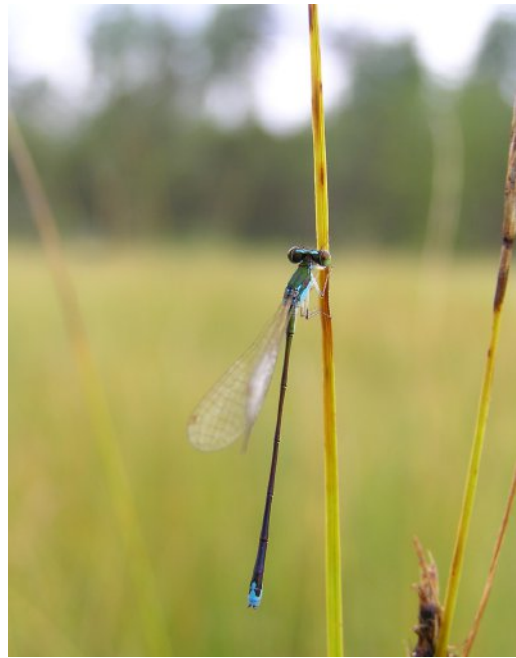
Figur 2. Hane av dvärgflickslända Nehalennia speciosa sittande på strå av trådstarr, Grytkärren. Notera den karaktäristiska ljusa linjen på baksidan av huvudet.

Dvärgflicksländans lilla kroppstorlek och korta vingar gör den sannolikt till en relativt dålig flygare, och dess förmåga och benägenhet att aktivt sprida sig tycks vara begränsad. Schmidt & Sternberg (1999) noterade att nästan inga individer rörde sig längre än 100 meter från de plat-