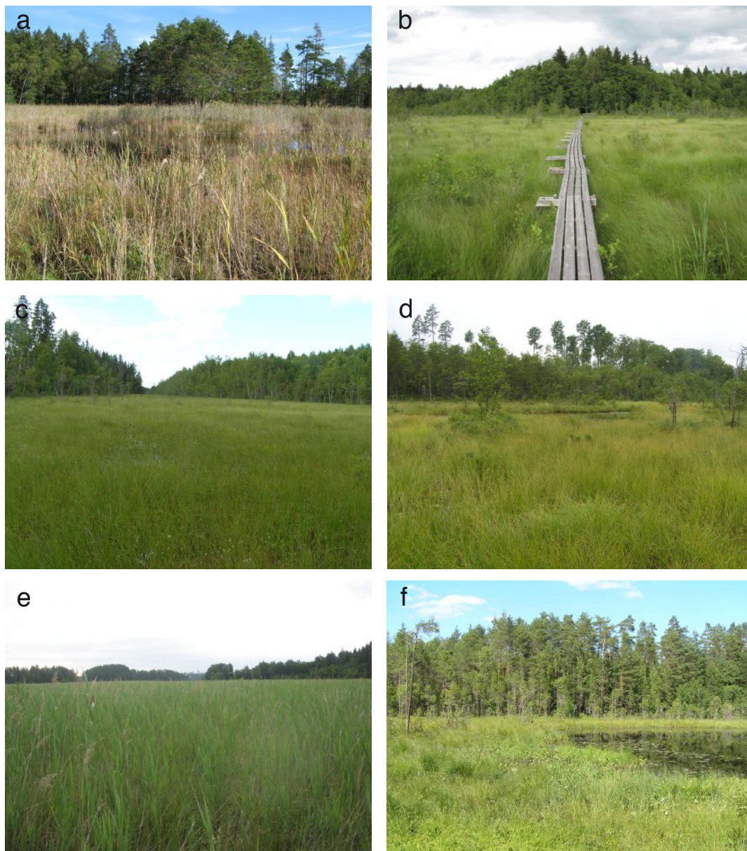
Figur 4. De sex lokaler där dvärgflicksländan Nehalennia speciosa hittats i Sverige under 2000-talet: – a) Käringsjön, 250 m SO, – b) Ekeby mosse, – c) Långkärren, – d) Grytkärren, – e) Hultamaden, – f) Skogsgölen.

Current localities for Nehalennia speciosa in Sweden: – a) Käringsjön, 250 m SO, – b) Ekeby mosse, – c) Långkärren, – d) Grytkärren, – e) Hultamaden, – f) Skogsgölen.