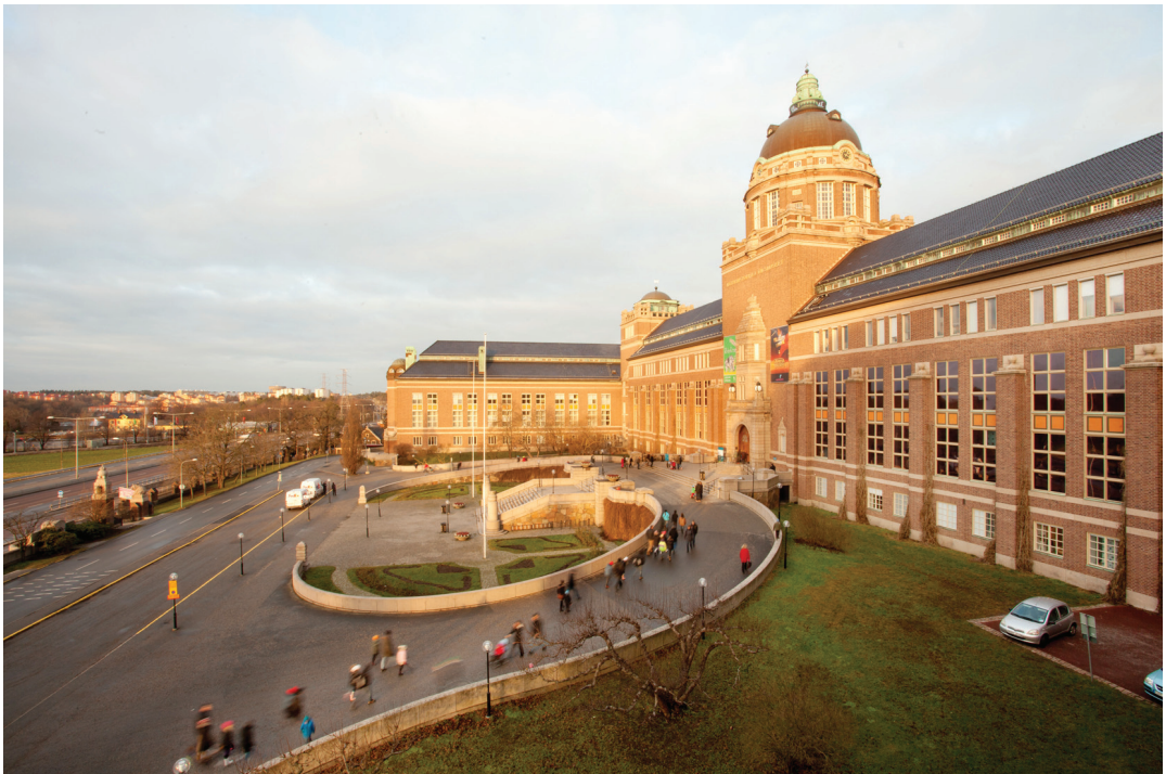
Figur 1. Naturhistoriska Riksmuseets huvudbyggnad stod färdig i Frescati i 1916.

Mindre än ett decennium efter att Naturhistoriska Riksmuseet flyttade till Frescati, år 1925, bildades föreningen Riksmusei Vänner som stödjer museet på många olika vis. Vi vill med den här artikeln dels informera om föreningen och uppmuntra till medlemskap, dels beskriva föreningens koppling till svensk entomologi och särskilt Renè Malaise.