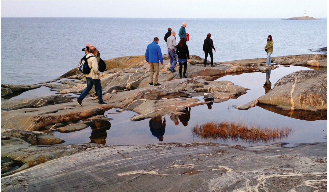
Figur 5. Fastigheten i Simpnäs by i Norrtälje kommun har lång strand som gränsar direkt till Ålands hav.

museet har möjlighet att förmånligt hyra stiftelsens stugor på Simpnäs.