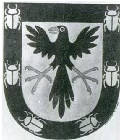
Noraströms landskommuns vapen.

Då ett flertal fall av identitet mellan sigillbild och öknamn är kända, föreligger här ett samband värt ett närmare studium.