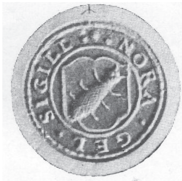
Nora yngre sockensigill. Från Höglin 1965.