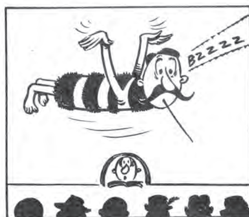
HAN SPELADE EN BIROLL...