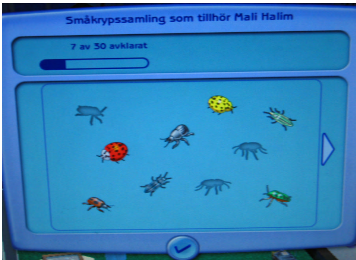
Skalbaggsdelen av en framgångsrik simmares insektssamling. De ännu saknade arternas konturer framgår som en slags hägringar.

Man kan inte låta bli att undra hur dessa svenska namn förhåller sig till sina engelska original. Rör det sig huvud-