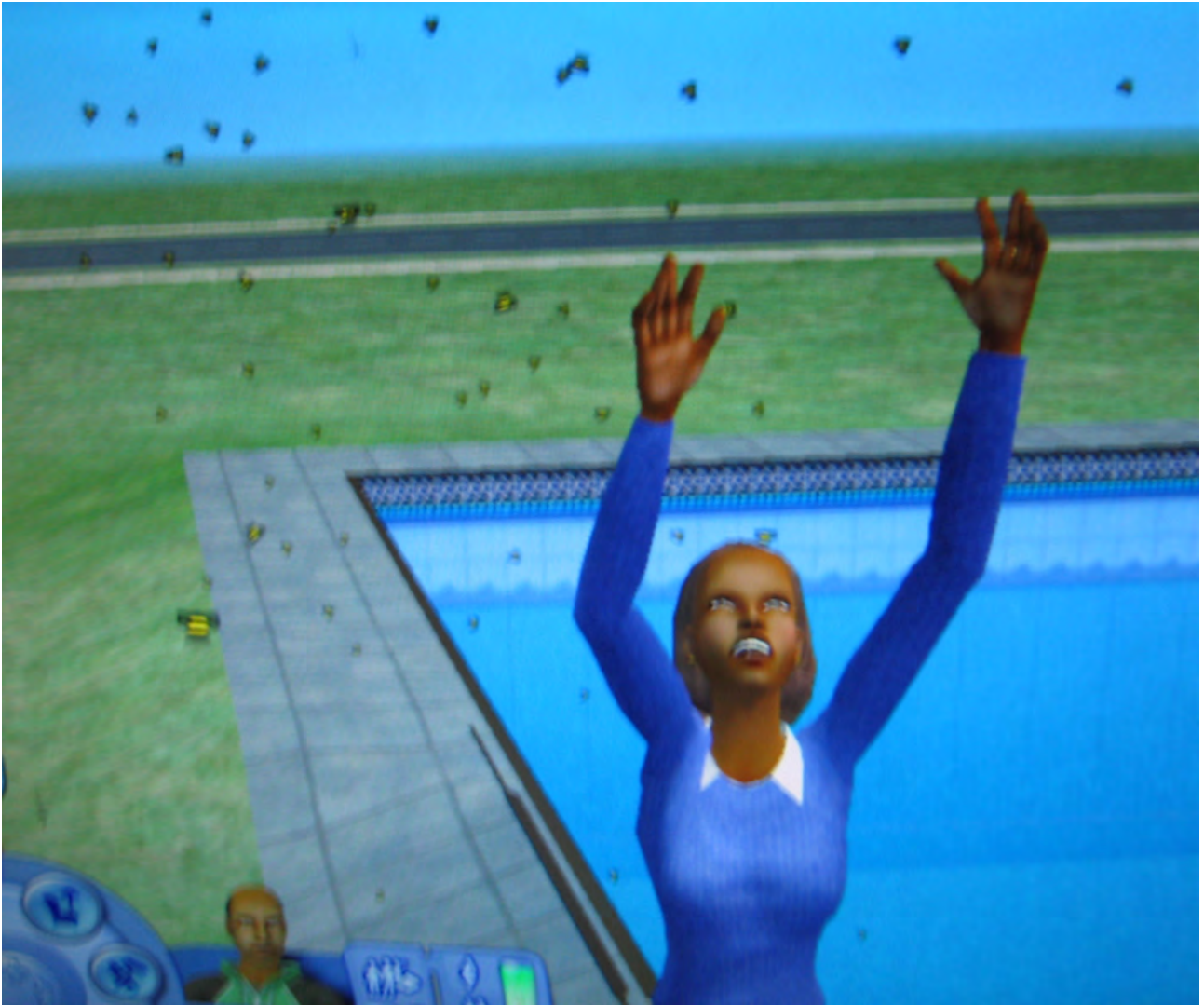
Kvinnlig simmare jagad av getingar vid sin egen pool. Bara hon inte nu är allergisk ...

sakligen om direktöversättningar eller har ambitionen varit att anpassa namnen till svenska förhållanden?