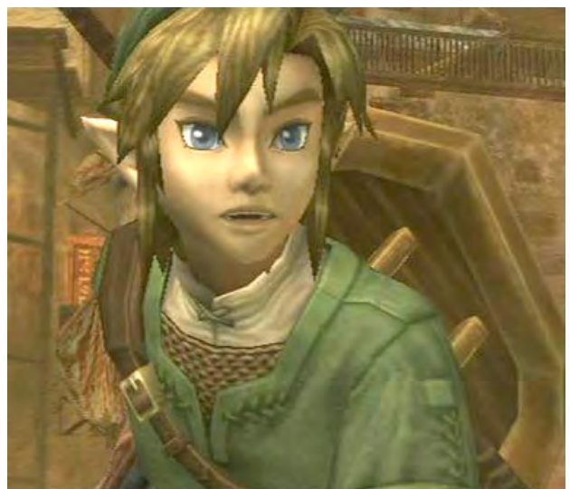
Insektssamlende alv från Legenden om Zelda.