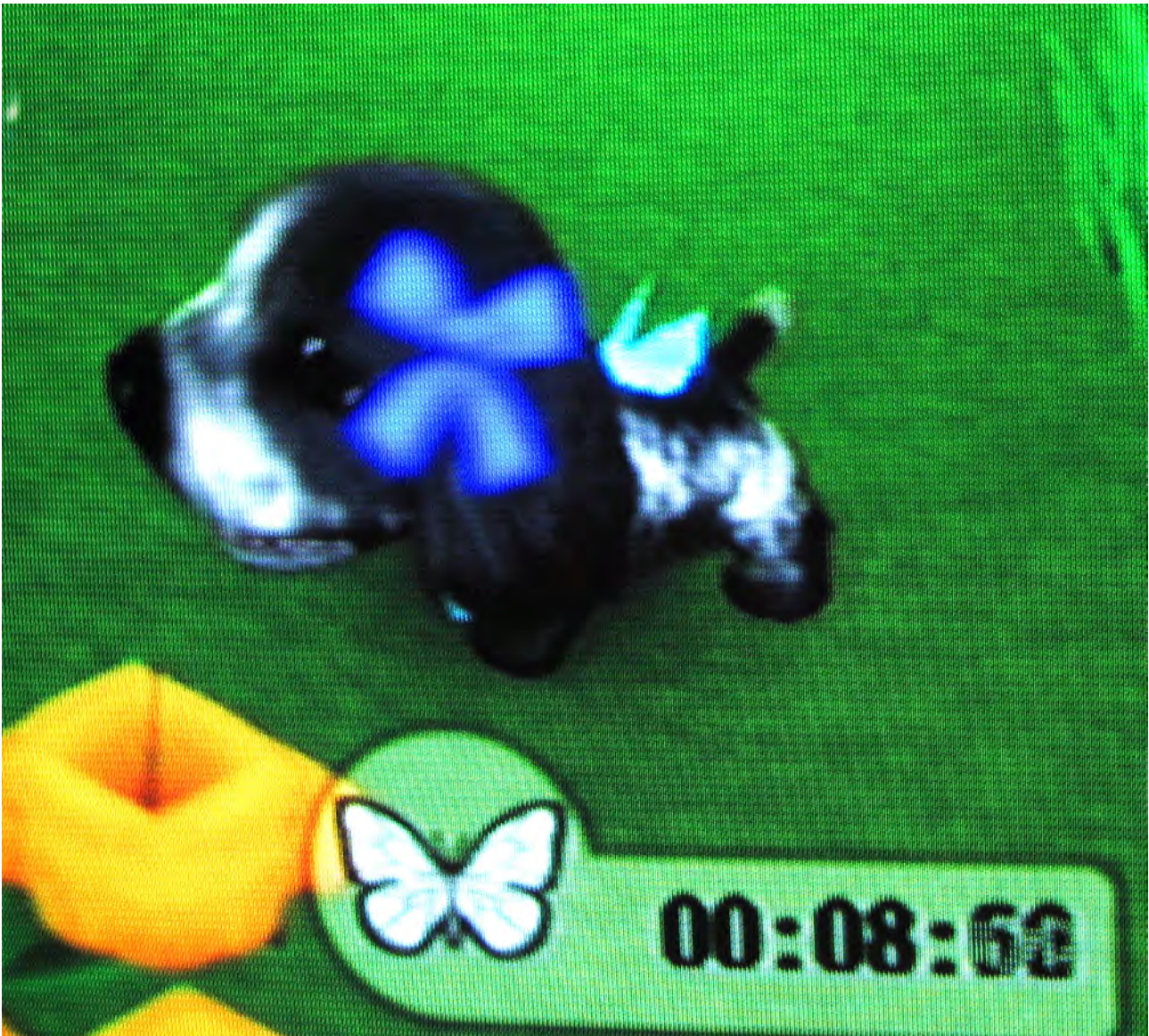
Din lilla valp på "Dog Island" är beredd att försöka fånga en fjäril. Inte ens en burk till hjälp har den.

Förutom artnamnen ger arkivet även lite information om varje art liksom artens "rank". Den senare har vi inte lyckats uttolka. För flertalet arter är det A, B eller