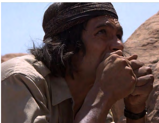
Duran gnager i sig av spikklubbans rotknöl.

”Det finns en gemensam nämnare – fladdermössen. Varje år dör hundratusentals kreatur av en paralytisk sjukdom som påminner om rabies. 1950 kom den till Trinidad, och där spred den sig från djuren till befolkningen. Man dödade alla hundar på ön, men det hjälpte inte. Det var först då de stora blodsugarna började anfalla människorna direkt, som man äntligen kom sanningen på spåren. Men det var förstås lite sent - åttionio personer hade redan dött vid det laget.”