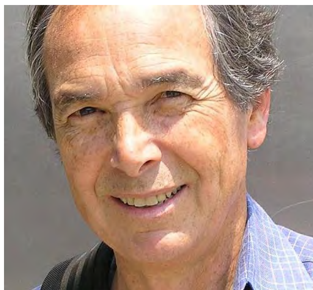
Författaren Martin Cruz Smith.